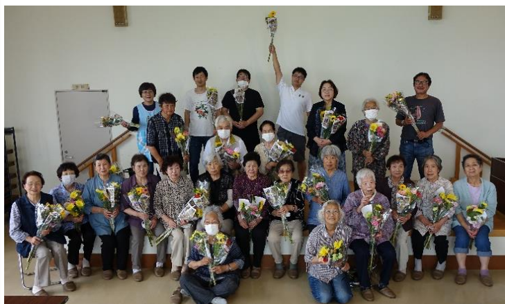
6月10日宮城県巨理町(わたりちょう) 荒浜公民館